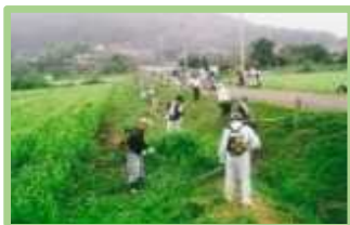
農地法面の草刈り