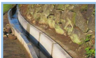
コンクリート水路の更新