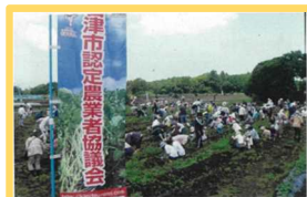
遊休農地の有効活用 (地域のジャガイモ収穫祭)