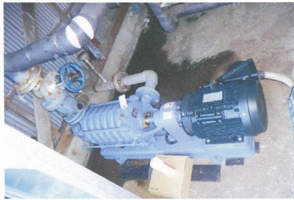
老朽化した畑地灌漑用ポンプの更新