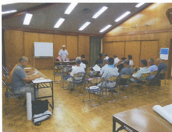
人・農地プラン見直し会議