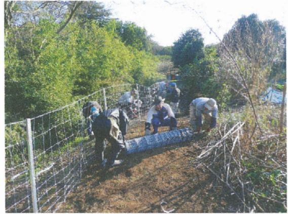
防護柵(金網)の設置