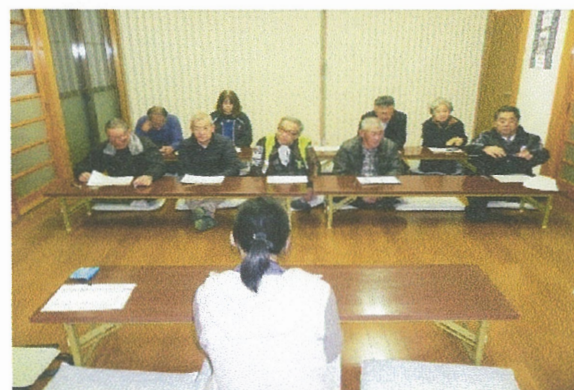
農地中間管理機構への手続き説明会