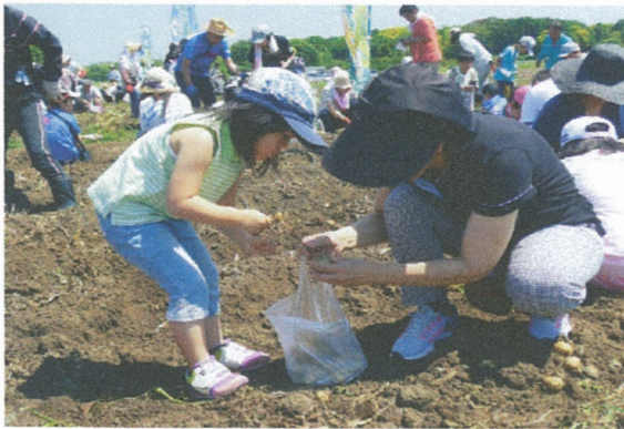
ジャガイモ収穫祭