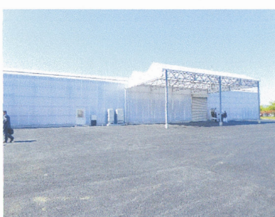
完成したトマト栽培施設