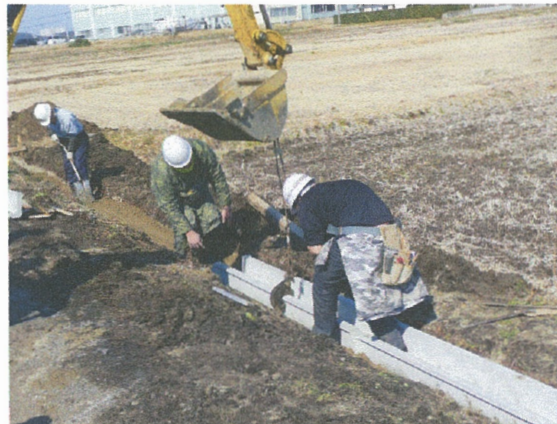
水利向上のための水路の改修