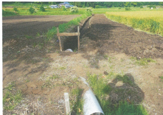
畑内に雨水排水用の素掘り水路設置