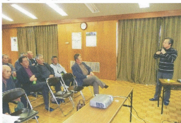
いすみ市の組織の視察対応