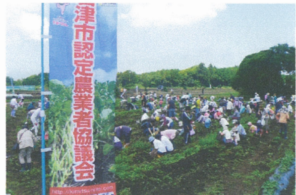
ジャガイモ収穫祭