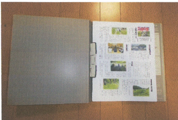
広報 三舟の里 212号