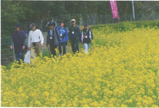
菜の花と三舟山・郡ダムお花見ウォーク