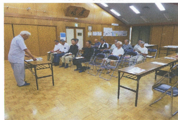
人・農地プラン見直し会議