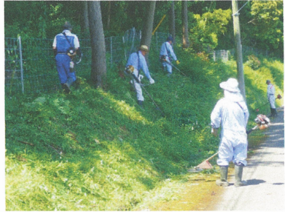
イノシシ防護柵の管理