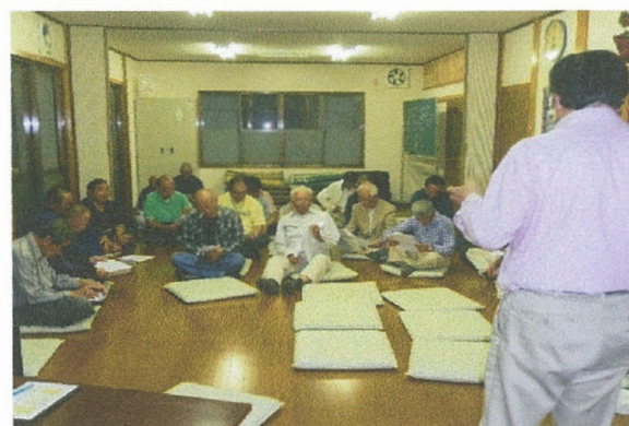
耕作者会議(H30初の試み) 三島ダムの現状と対策協議