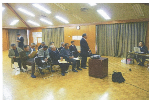
山梨県北杜市の組織の視察対応