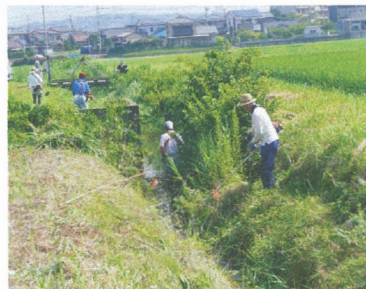
河川内の支障木、ヨシの刈取り