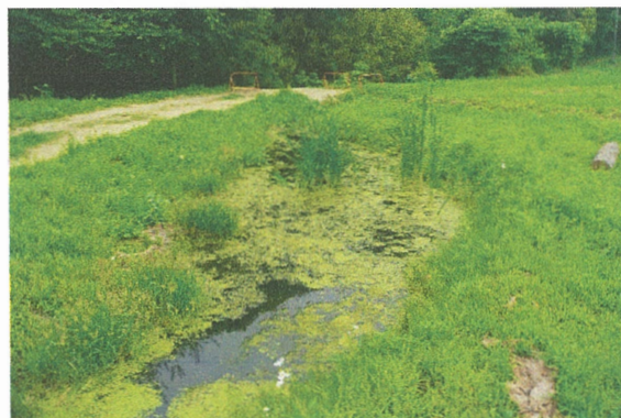
ビオトープの様子