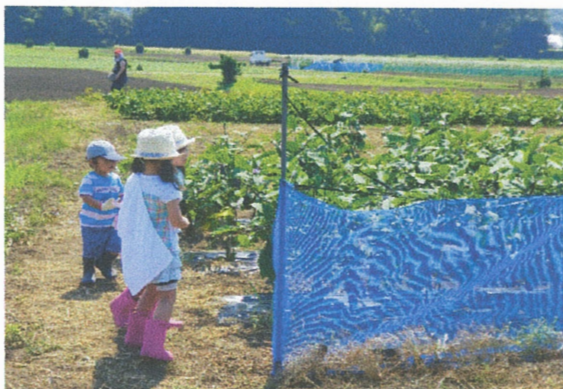
企業と連携した収穫体験