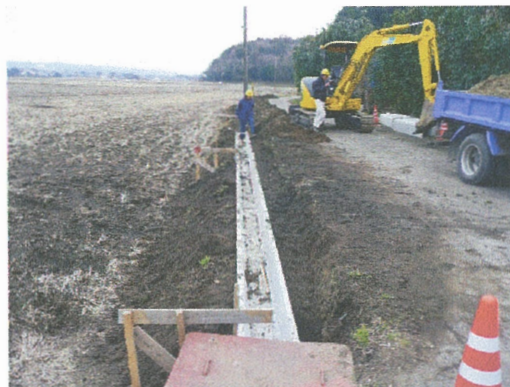
構造物の大きな水路は安全優先で委託