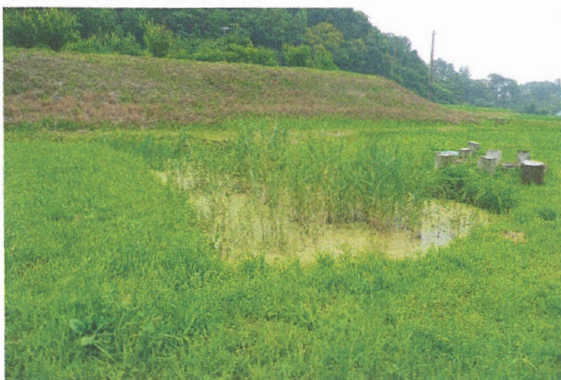
ビオトープの様子