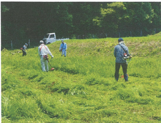
遊休農地管理の定期的な草刈り