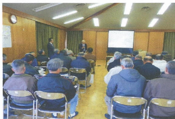
袖ヶ浦市の組織の視察対応