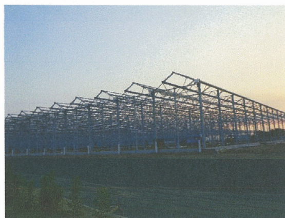
建設が進むトマト栽培用大型ハウス