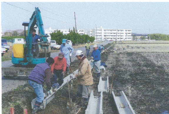
H20に共同による初の改修にチャレンジ