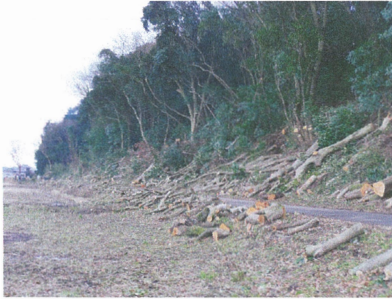
防護柵設置箇所確保のための伐採 写真奥は隣接の貞元集落に続く