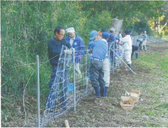
イノシシ防護柵の設置