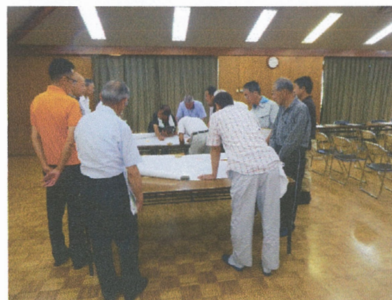
出し手、受け手の地図上の話し合い