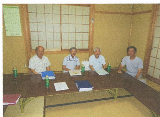
市内新規組織への事務講習