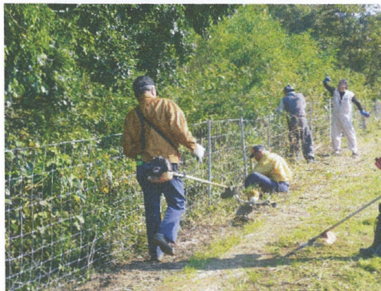
設置した防護柵の除草管理