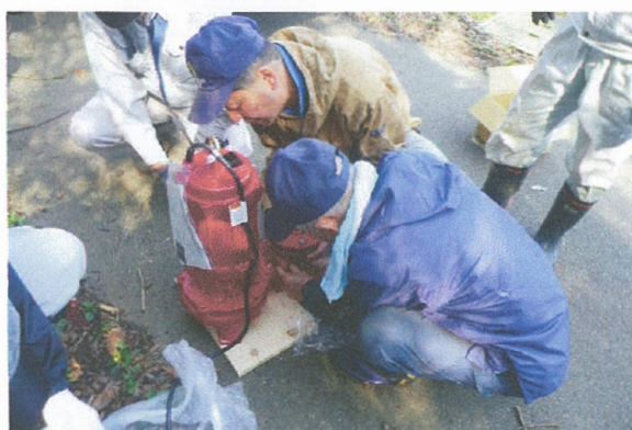
老朽化した水中ポンプの更新